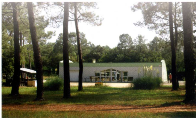
BELZ – ERDEVEN

Animaux en laisse acceptés, (avec carnet de vaccination à jour)